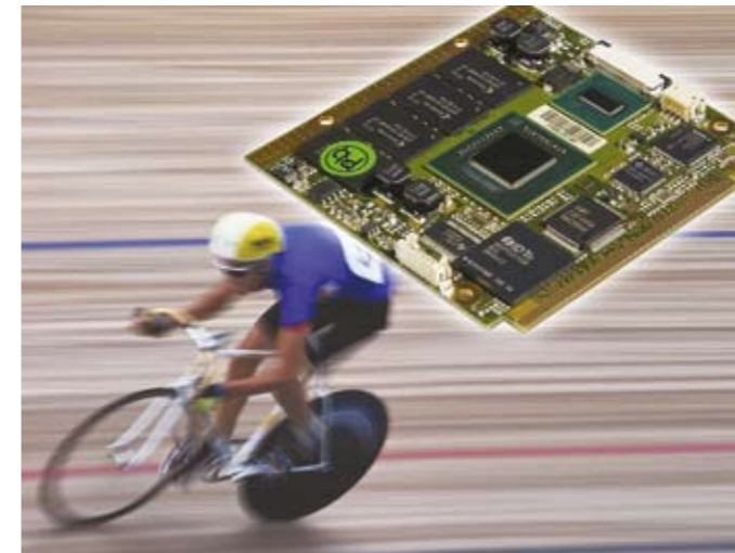
Bild 2: Das Computer-on-Modul »MSC Q7-US15W« von MSC entspricht dem offenen »Qseven«-Standard und ist das Herzstück der Referenzplattform »Hpe_IRP«

Aufgrund der flexiblen FPGA-Architektur sind Entwickler in der Lage, zur Realisierung ihrer spezifischen Applikation neben den von in der Industrie gängigen Schnittstellen ihre kundenspezifische Logik zu integrieren. Darüber verkleinert sich wegen des FPGA-Konzepts das Abkündigungsrisiko. Um unterschiedliche Feldbus- und Echtzeit-Ethernet-Protokolle zu unterstützen, inte-